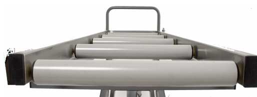
Option : civières à glissières

Construction : Chariot à double croisillon, en acier tubulaire