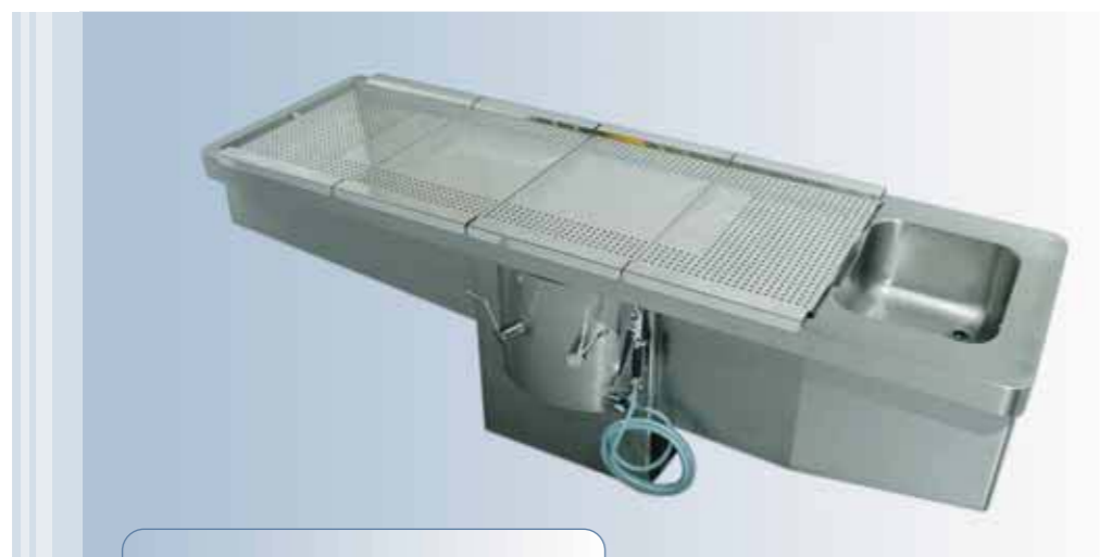
Table d'autopsie EVOLUTION III EVOLUTION III autopsy table with extraction facilities